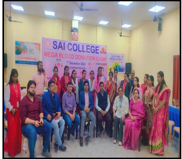
Blood Donation Camp by RRC, YRC in Collaboration With HDFC Bank & District Hospital, Durg