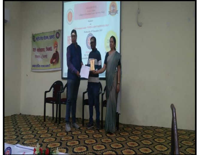
Guest Lecture on AIDS Awareness on 4 th December 2024